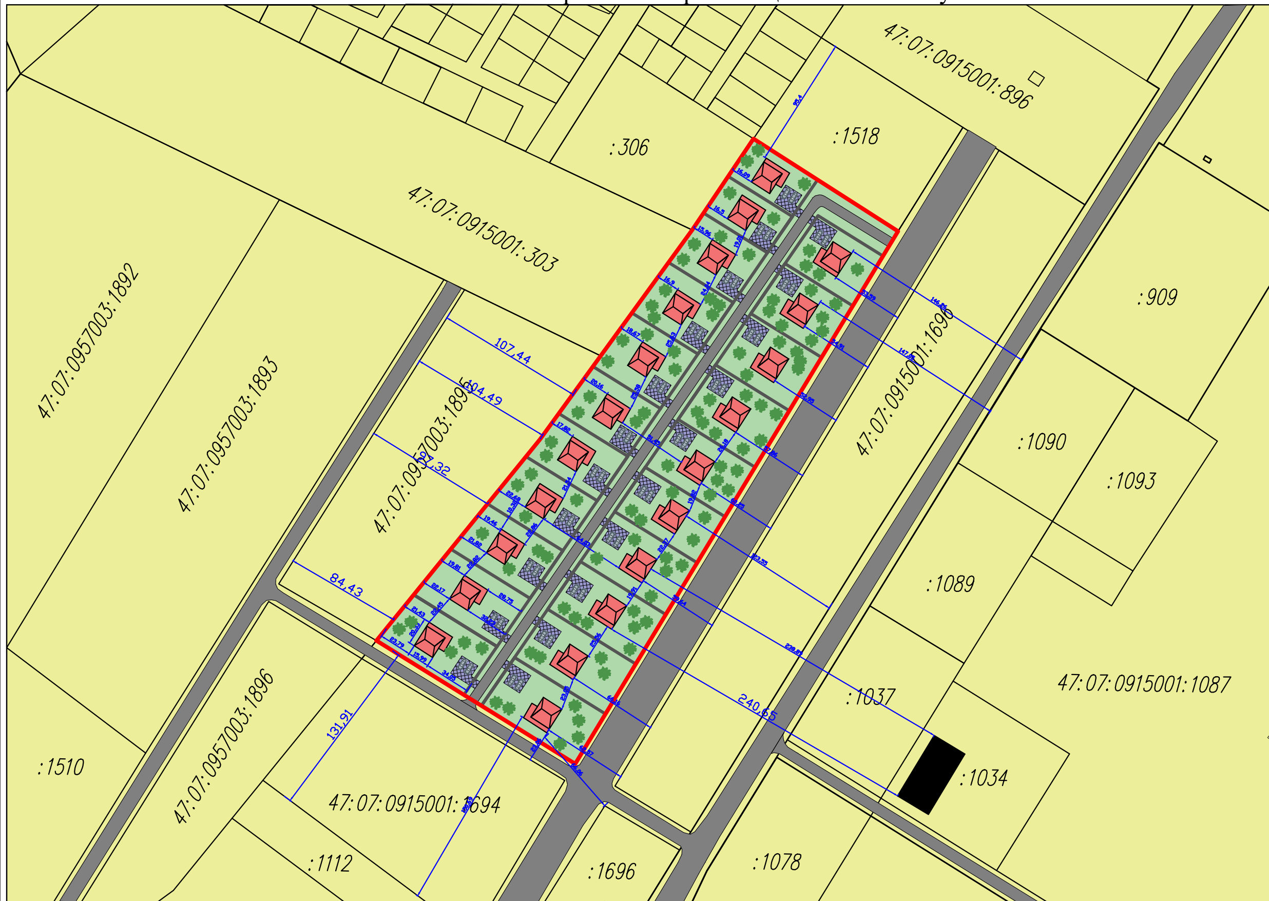
Схема планировочной организации земельного участка